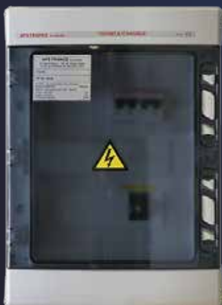
AC/DC et porte fusible